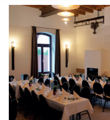
Veranstaltungsraum Seminare, Feiern