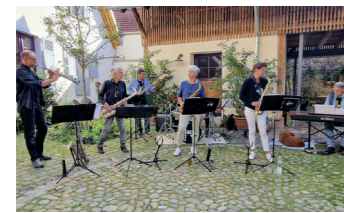
Live-Musik-Atmosphäre im Hof

Die positive Resonanz und der Wunsch vieler Künstler hat uns bewogen, im kommenden Jahr auch Theater- und Abendveranstaltungen mit in unser