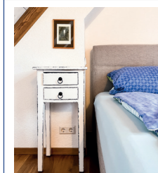
Ferienwohnungen für 2-8 Personen